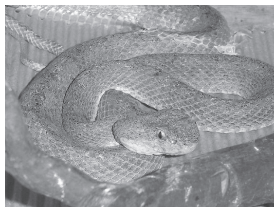
B) La Bothriechis schlegelii (víbora de tierra fría o cafetal) causa accidentes en recolectores de café y de cultivos de frutas, pero su toxicidad se considerada de mediana a baja.