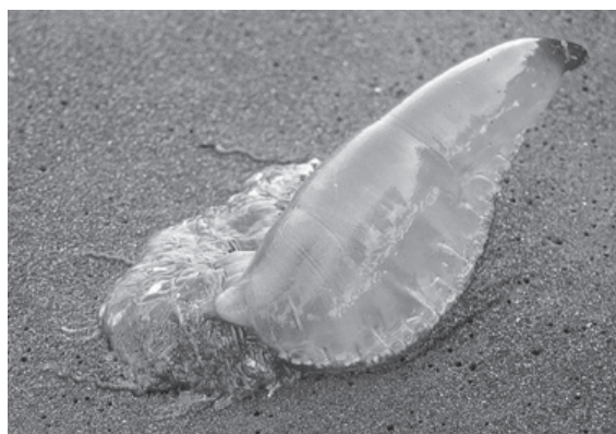
Figura 4. Invertebrado causante de accidentes ocupacionales ( Physalia physalis )

tas y pescadores en las costas (figura 4). Haddad reporta en el 2002 en el suroeste de las costas de Brasil (Ubatuba), en un periodo de observación entre de 1997 y junio de 1998, enero de 1999 a junio del 2000 y en el 2001 un total de 49 casos, presentados entre hombres 32/49 (65,3%). Este mismo autor reporta brotes de P. physalis † ocurridos en Guaruja (200 km al sur de Ubatuba), con casi 300 picaduras en 1994 [57]. En Colombia se conoce su presencia en sus costas pacífica y atlántica. Todos los años hay casos en bañistas y pescadores, pero su casuística es casi nula (el subregistro es casi que total), por lo que no se sabe de su impacto ni humano ni laboral (figura 4).