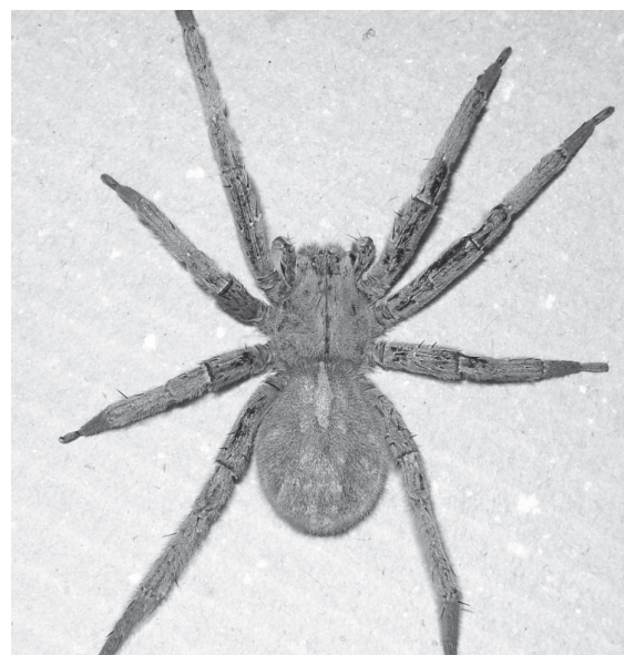
a) Phoneutria spp (araña de las bananeras) es la araña de mayor importancia en recolectores de banano, palma africana y frutales de zonas cálidas a templadas en Colombia.

Las arañas del infraorden Mygalomorphae, también conocidas como tarántulas o arañas polleras, son de cuerpo veloso y pueden alcanzar hasta 25 cm de longitud total. El envenenamiento causado por la mordedura de estas arañas solo provoca síntomas locales como dolor, edema, eritema y, a veces infarto ganglionar (figura 3). Otro grupo de arañas importantes por su amplia distribución geográfica y por el número de accidentes que se observan en los servicios médicos son los causados por el género Lycosa , de frecuente presencia en los jardines; de hecho, muchos de los accidentes que se le atribuyen a Phoneutria realmente los causa este tipo de arañas, pero en caso de mordedura, al igual que con las tarántulas [28], el tratamiento se reduce a la administración de analgésicos [48]; sin embargo, hay que tenerlas en cuenta al momento de determinar incapacidad en salud ocupacional.