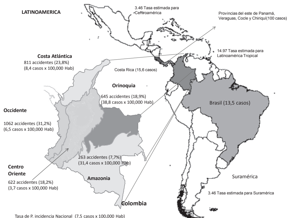
Figura 2. Proporción de incidencia de accidente ofídico para América latina (número de casos por 100.000 habitantes/por año)

En el 2010, en su informe anual sobre accidente ofídico en Colombia, el Instituto Nacional de Salud (INS) reportó que hasta el décimo tercer período epidemiológico del 2009 hubo un total de 3.405 casos comprobados de accidente ofídico. Por municipios, 553 de 1.119 resultaron afectados (49,4%), lo que da una idea de la magnitud del evento [31]. El INS reportó que la proporción de incidencia nacional por 100.000 habitantes es de 7,5 casos; por región geográfica, la mayor incidencia ocurre en la Amazonia (31,4 casos por 100.000 habitantes) y la Orinoquía (38,8 casos por 100.000 habitantes) (figura 2) [31].