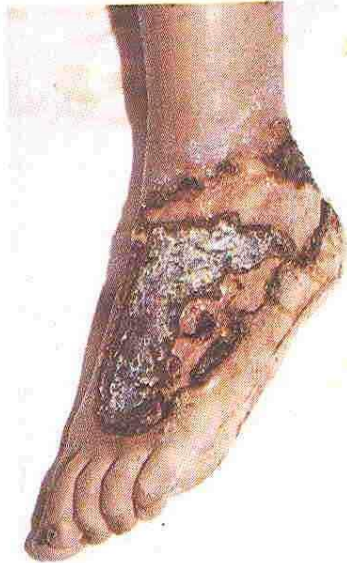
Figura nº 4. Loxoscelismo cutáneo con 4 semanas de evolución. Escara en dorso de pie que permite observar una úlcera de contorno irregular.